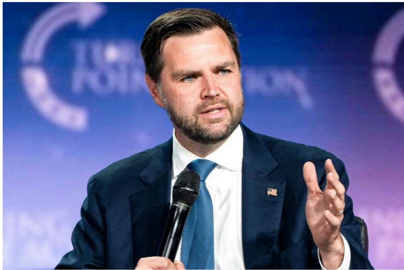
«Трамп підтримає будь-яке моє рішення»: Джей Ді Венс заінтригував заявою про свою участь у президентських виборах 2028 року

Віцепрезидент США Джей Ді Венс заявив, що поки не ухвалив рішення щодо участі у президентських виборах 2028 року.