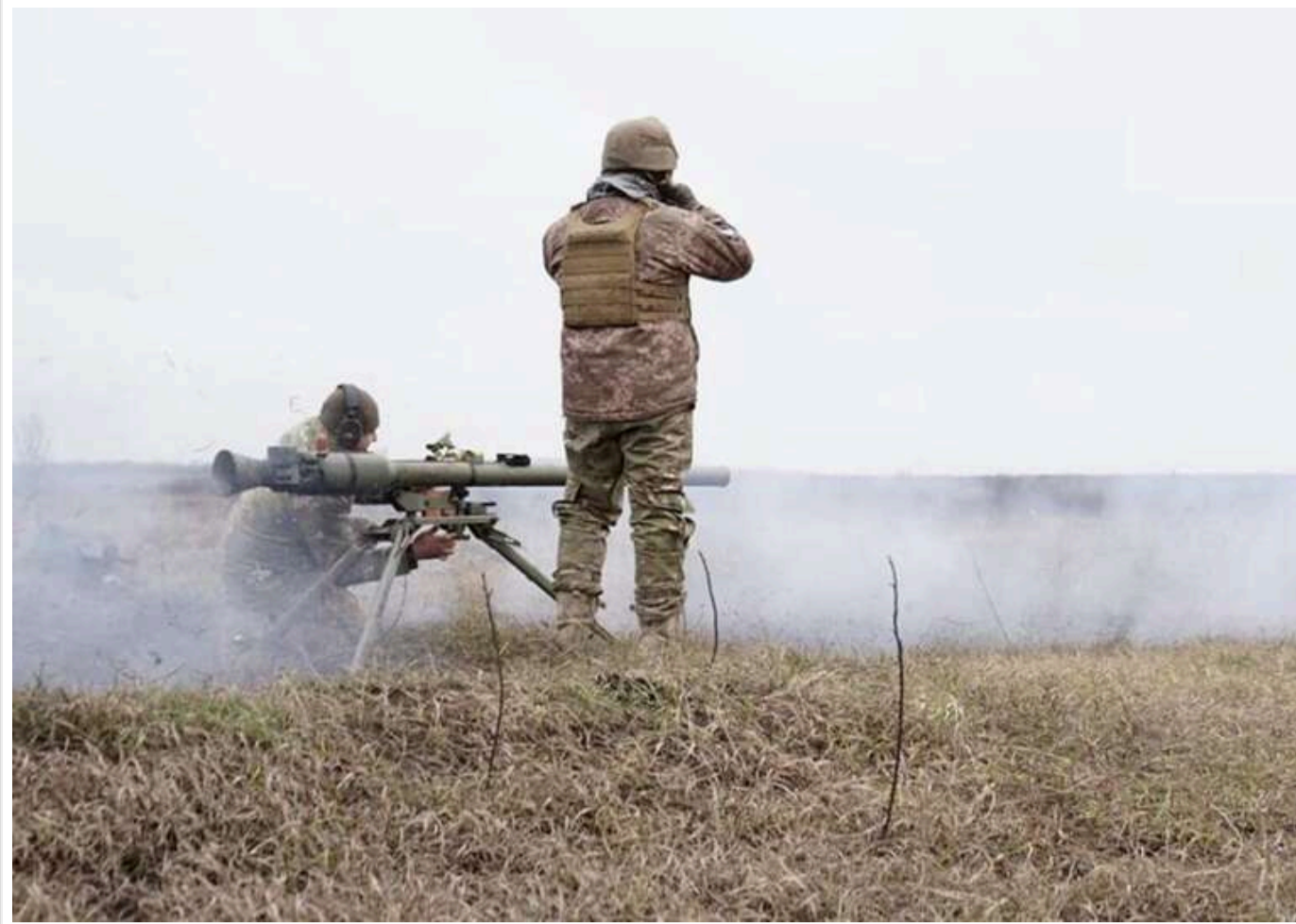
Ситуація на фронті: РФ завдала масованих ударів і здійснила понад 85 авіаударів та понад 9 тисяч атак дронами

Загалом від початку цієї доби сталося 118 бойових зіткнень.