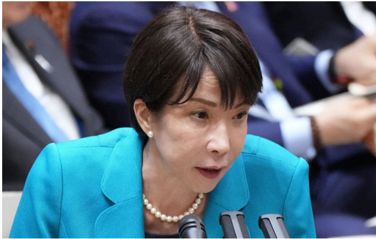
Прем'єр-міністерка Японії Санае Такаїчі

Напередодні саміту G7 Японія активізувала контакти з Москвою на тлі побоювань щодо енергетичної безпеки.