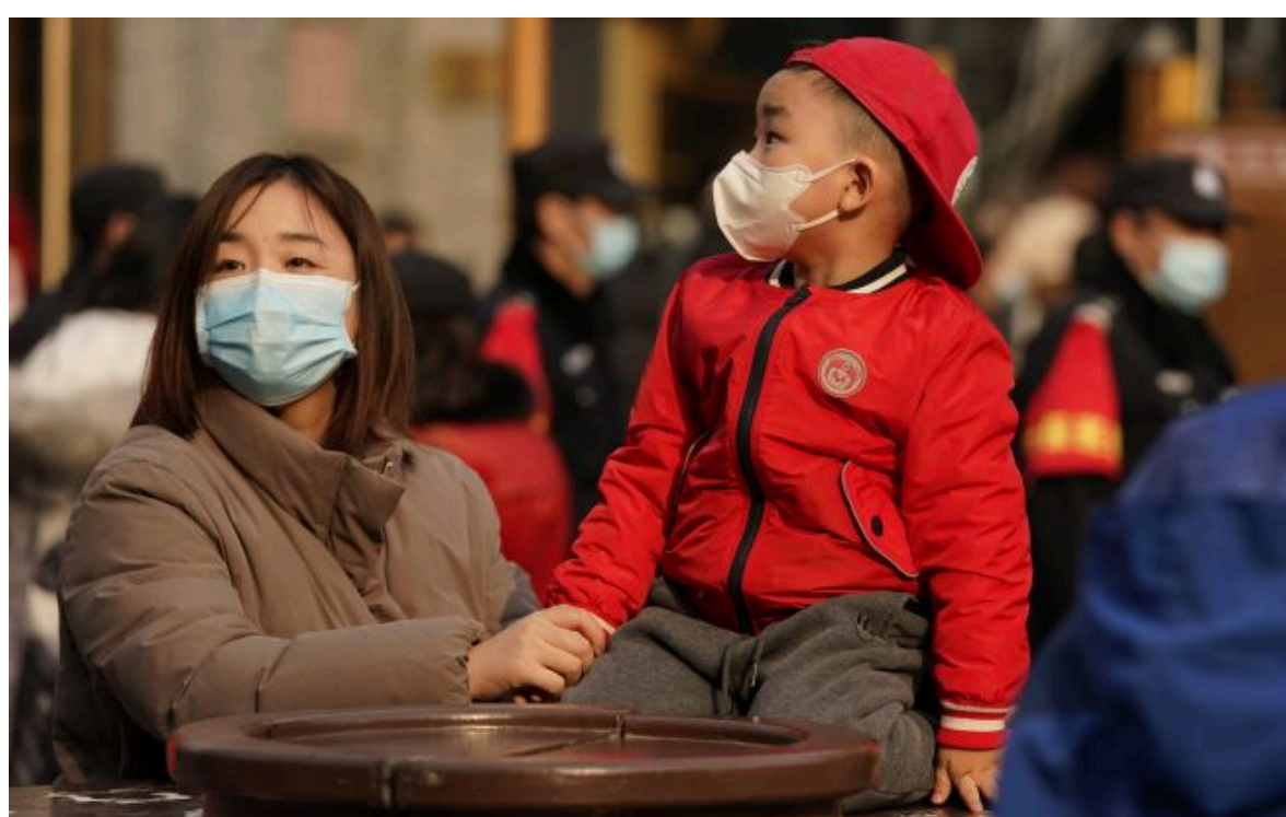
Фото: два роки тому Китай і сам намагався застосовувати аналогічну тактику