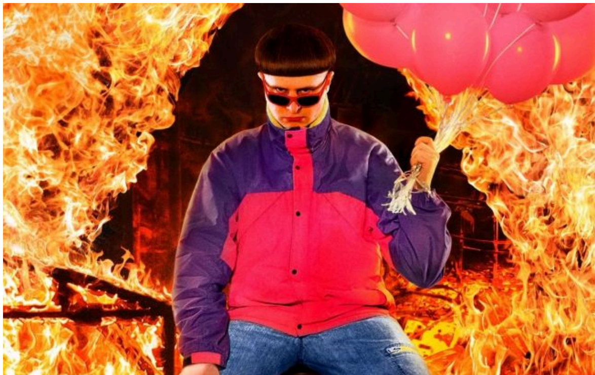
Фото: американський співак Олівер Трі (facebook.com/OliverTreetmusic)