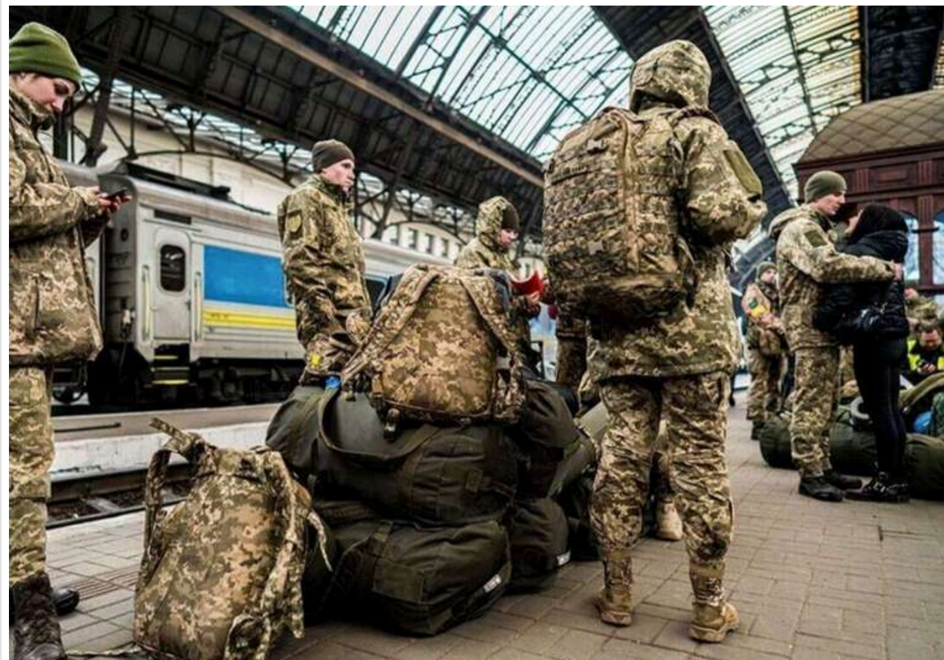
Поетапна демобілізація в Україні може розпочатися до кінця 2026 року, – Міноборони

Поступова демобілізація військовослужбовців з максимальною вислугою може початися ще до кінця 2026 року.