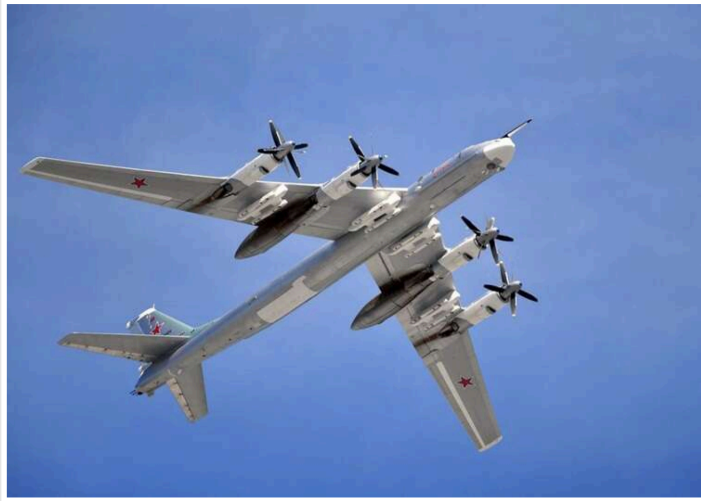
Моніторингові канали повідомляють про зліт стратегічної авіації РФ

Моніторингові канали повідомляють про зліт російських стратегічних бомбардувальників.