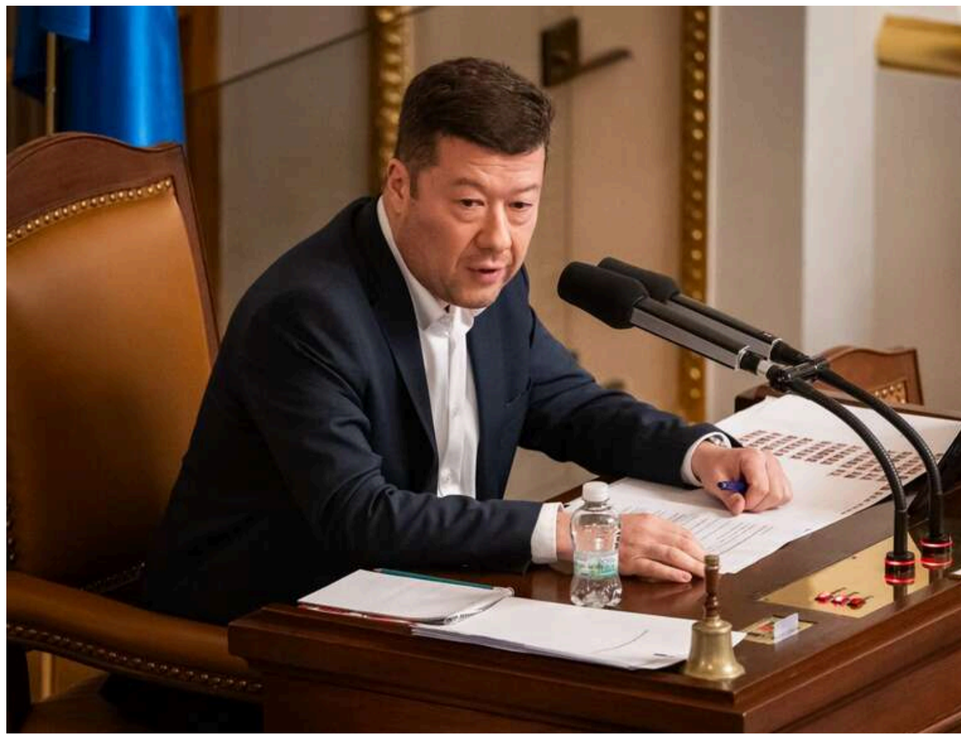
Томіо Окамура заявив про намір скасувати тимчасовий захист для українців у Чехії

У Чехії хочуть скасувати статус тимчасового захисту для українських біженців. Подальше перебування українців в країні опинилося під питанням через нібито незадоволення місцевих громадян та політичні суперечки щодо їхньої ролі в економіці.