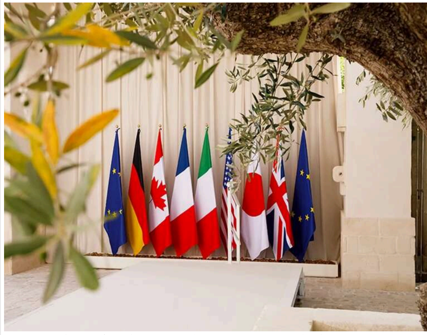
Історичні зміни у G7: саміт у Франції бойкотує Китай і ПАР, але вперше запросив нового лідера Сирії

В Євіані (Франція) 15 червня розпочинається триденний саміт лідерів країн «Великої сімки» (G7), склад учасників якого зазнав радикальних геополітичних змін.