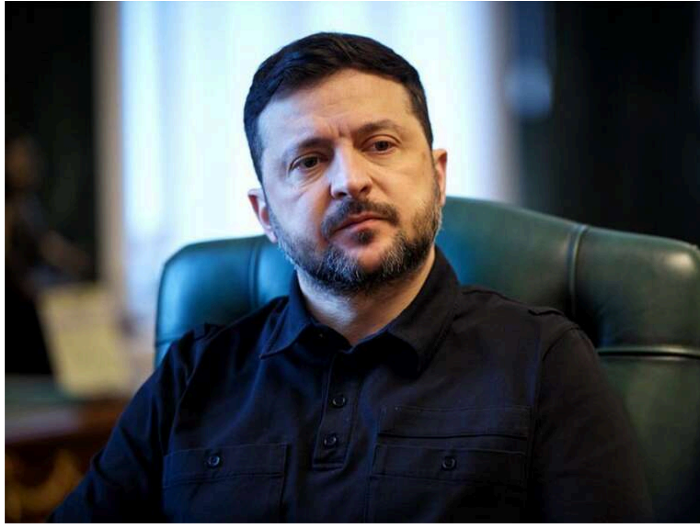
Зеленський подякував Британії за перше затримання танкера російського «тіньового флоту»

Читати на руськом Read in English Додати як бажане джерело в Google