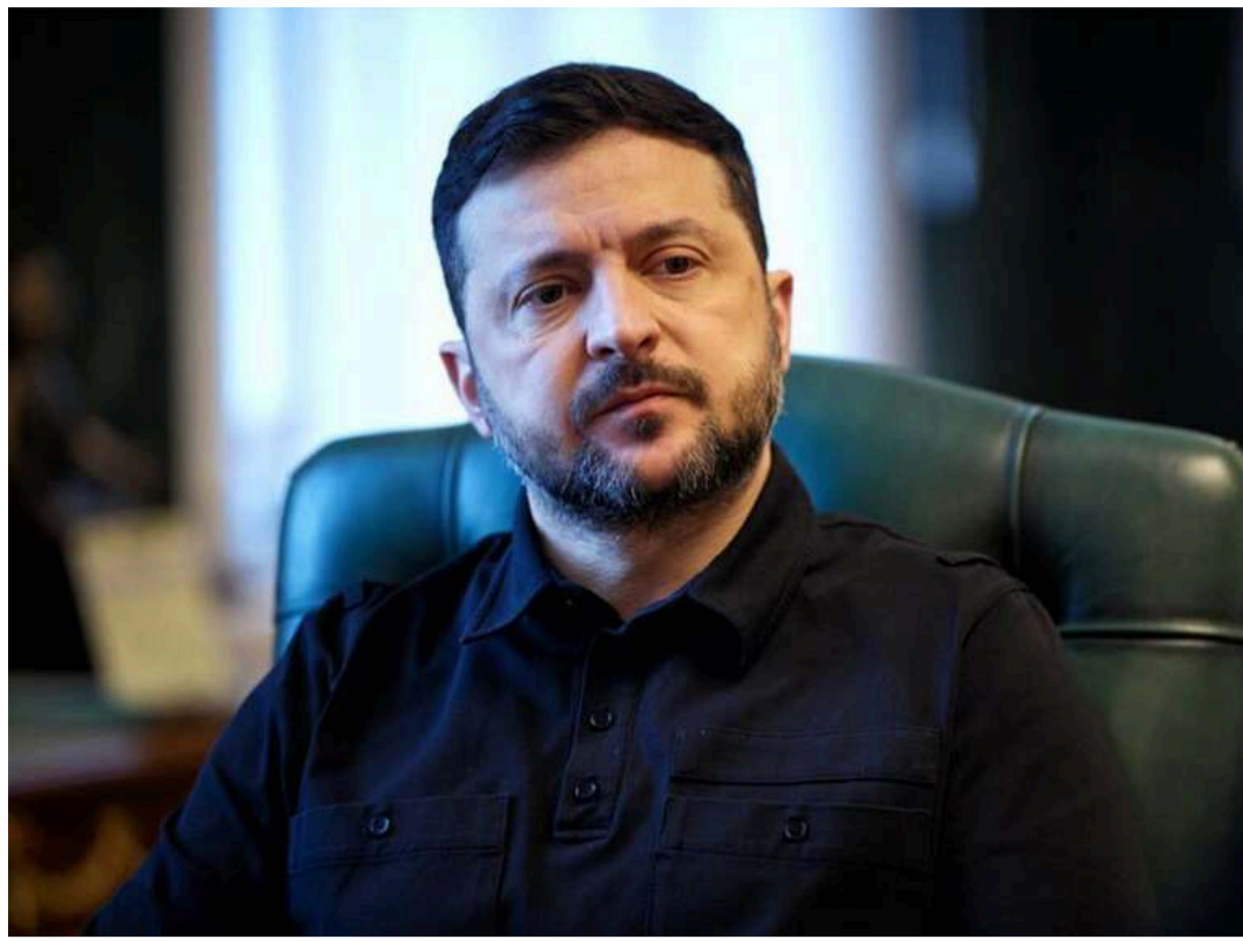
Зеленський подякував Британії за перше затримання танкера російського «тіньового флоту»

Президент Володимир Зеленський подякував Великій Британії за затримання нафтового танкера російського "тіньового флоту".