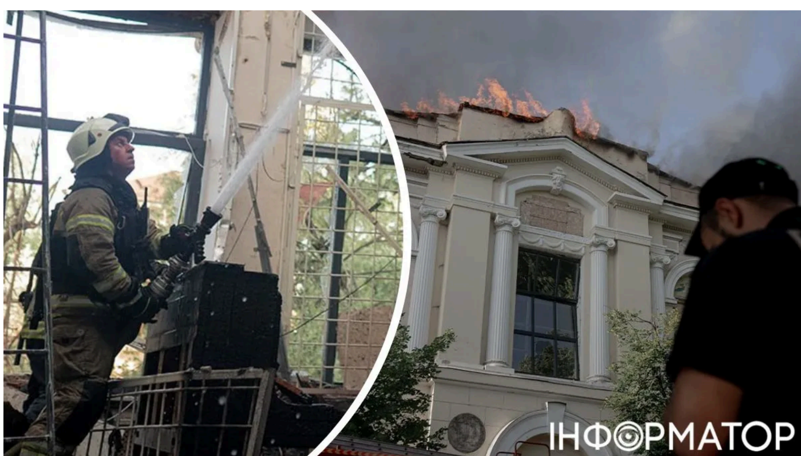
Наслідки удару по художньому музею Харкова.

Російський Шахед у неділю, 14 червня, вдарив по Харківському художньому музею - одній з найстаріших культурних інституцій України. Йдеться про пряме попадання в музей. Серед постраждалих у місті є немовля.