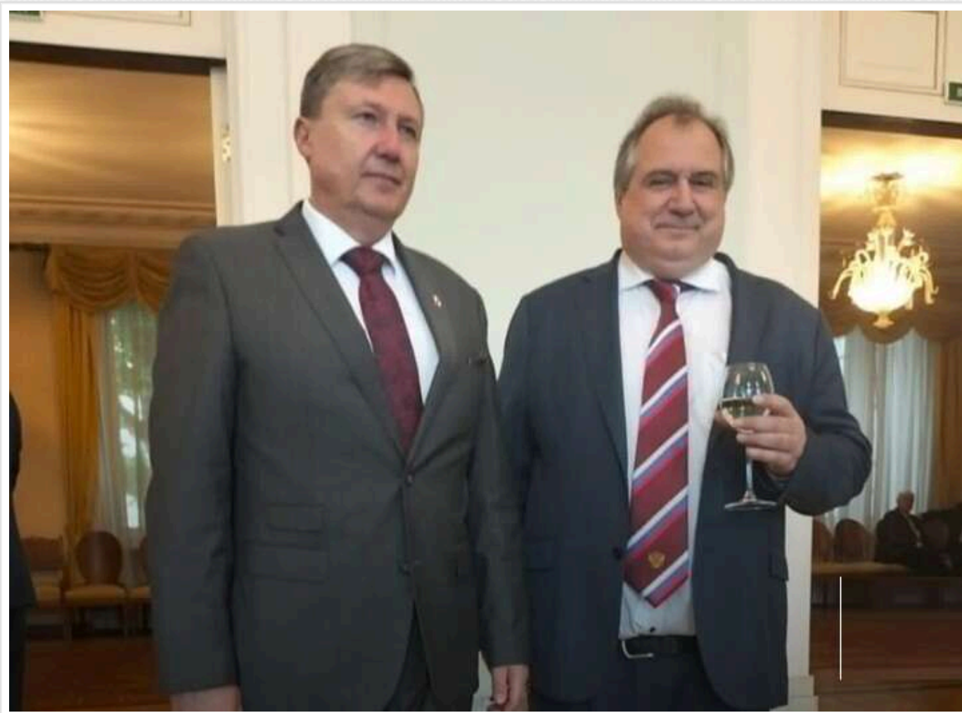
Парламентська партія Польщі оголосила про зближення з РФ: її представник засвітився на прийомі в посольстві з агентом Кремля

Читати на руськом Додати як бажане джерело в Google