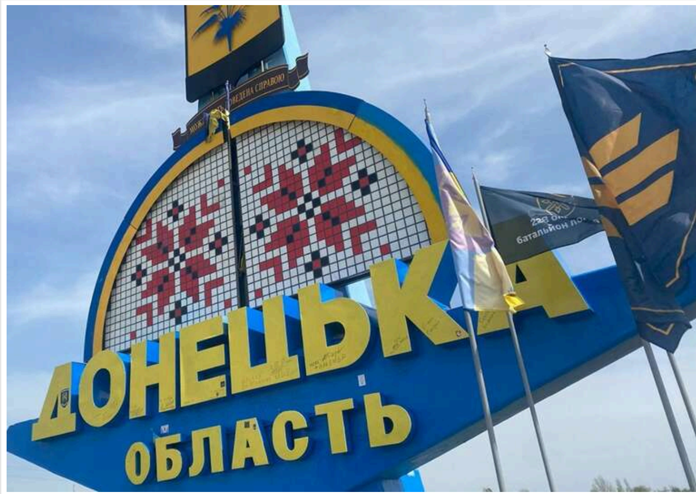
Російська влада звітує про зростання народжуваності в окупованій Донеччині, але статистика ЗАГСів суперечить заявам

Читати на русском Додати як бажане джерело в Google