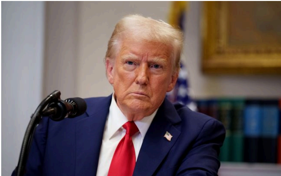
Фото: Дональд Трамп (Getty Images)

Не витрачай час на шум! Читай тільки суть з РБК-Україна у Google