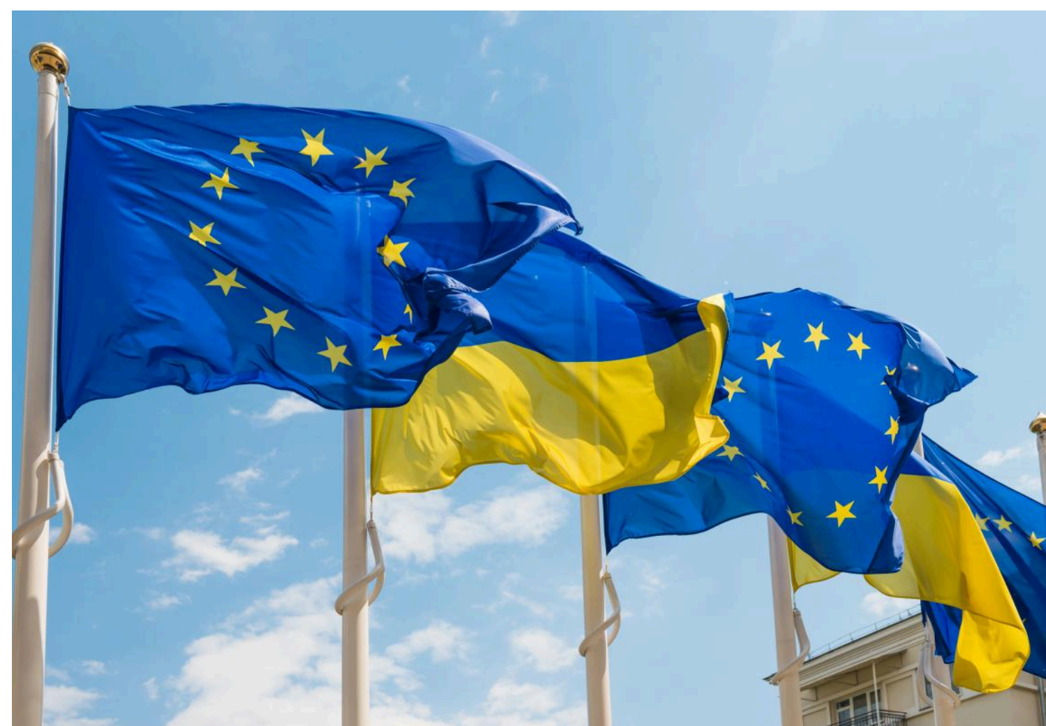
Європейські чиновники незадоволені тим, що Україна повільно впроваджує необхідні реформи

Чиновники ЄС зазначили, що Україна виконала лише 15% реформ, передбачених 10-пунктним планом.