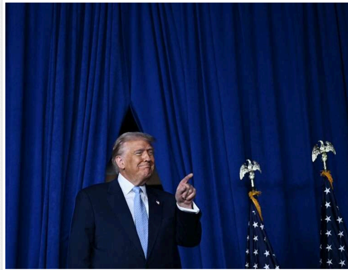
Трамп розкритикував Нетаньягу за удар по Бейруту, але досі сподівається на мирну угоду з Іраном, — Axios

Читати на руском Додати як бажане джерело в Google