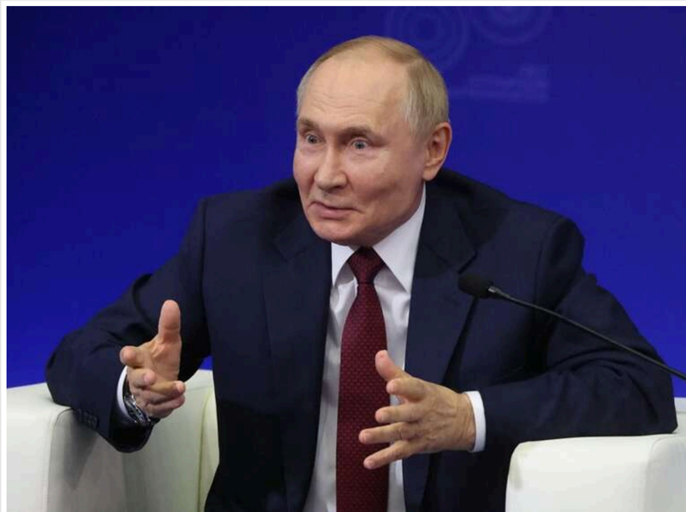
Путін опинився у складній стратегічній ситуації через виснаження сил в Україні, — The Guardian

У західних медіа дедалі частіше з'являються оцінки, що Володимир Путін опинився у складній стратегічній ситуації через війну проти України. Аналітики та оглядачі говорять про зростання ризиків для Кремля на тлі військових і політичних втрат.