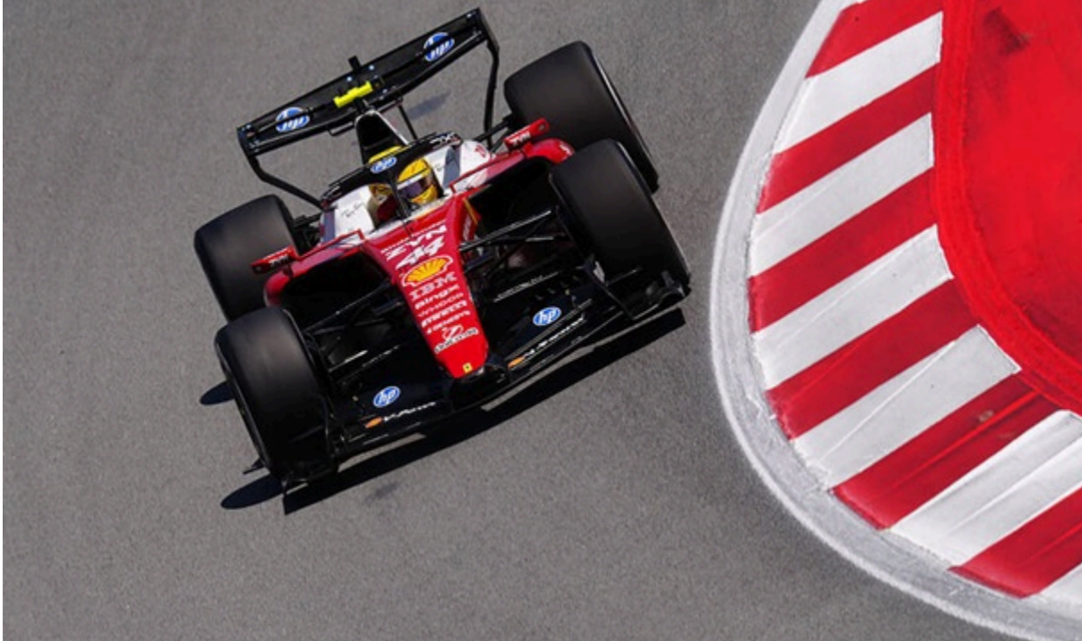
Льюїс Гамільтон

Британський автогонщик святкує першу перемогу у складі нової для себе команди, ставши переможцем Гран-прі Барселони.