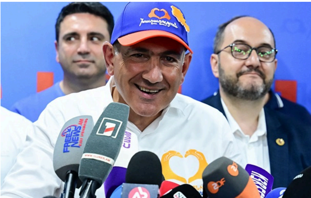
Партія Пашиняна перемогла на виборах у Вірменії

Центрвиборчком Вірменії у неділю оголосив остаточні результати парламентських виборів, котрі відбулися 7 червня.