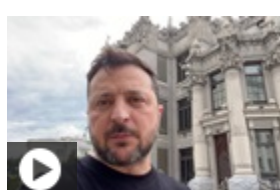
Зеленський зустрінеться з Трампом на G7

В Росії пропонують підвизити затриманих "тіньові" танкери