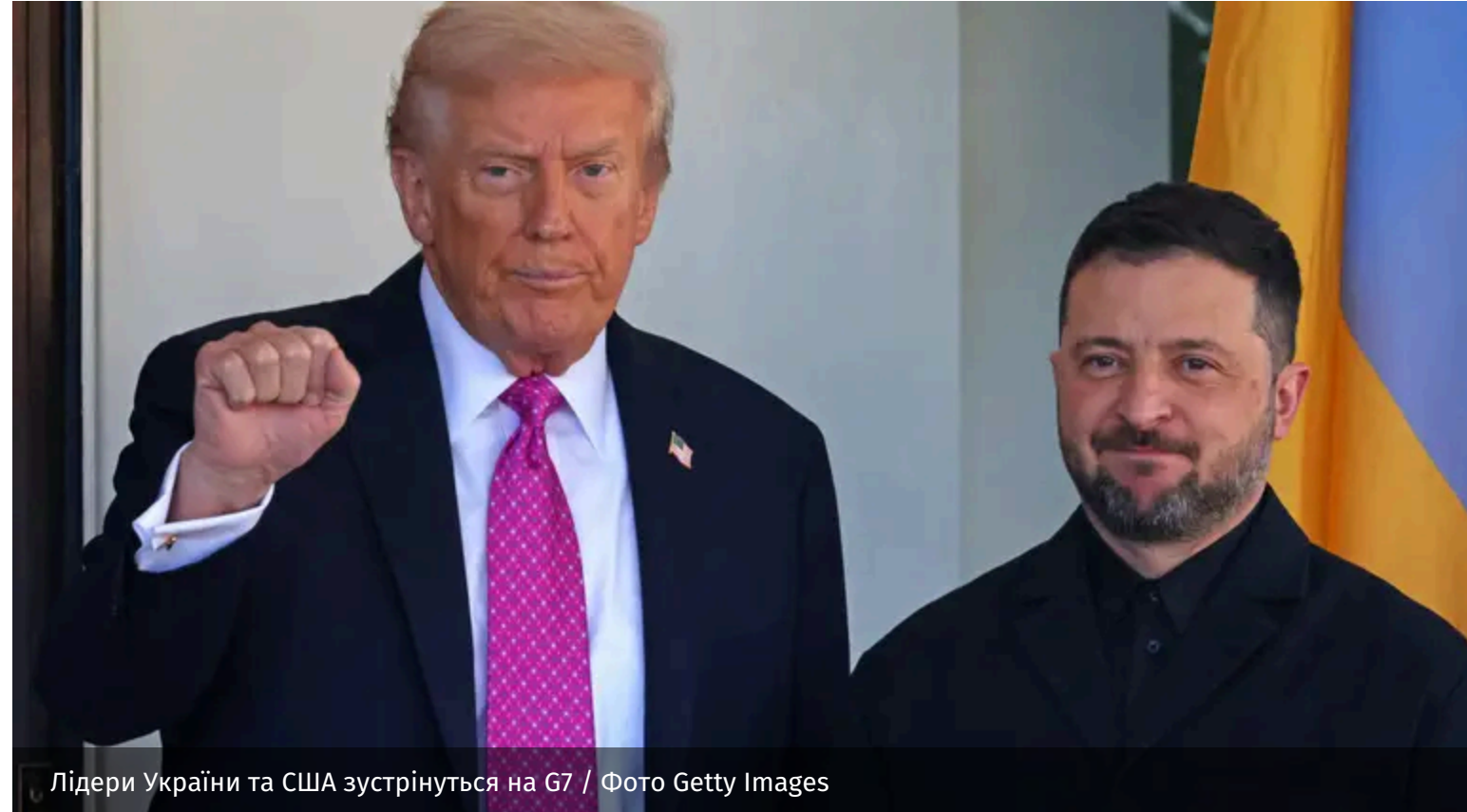
Лідери України та США зустрінуться на G7

Володимир Зеленський підтвердив, що проведе особисту зустріч із президентом США Дональдом Трампом під час саміту G7. Напередодні лідери провели телефонну розмову, у якій детально обговорили перспективи завершення війни, ситуацію на фронті та подальшу підтримку України.