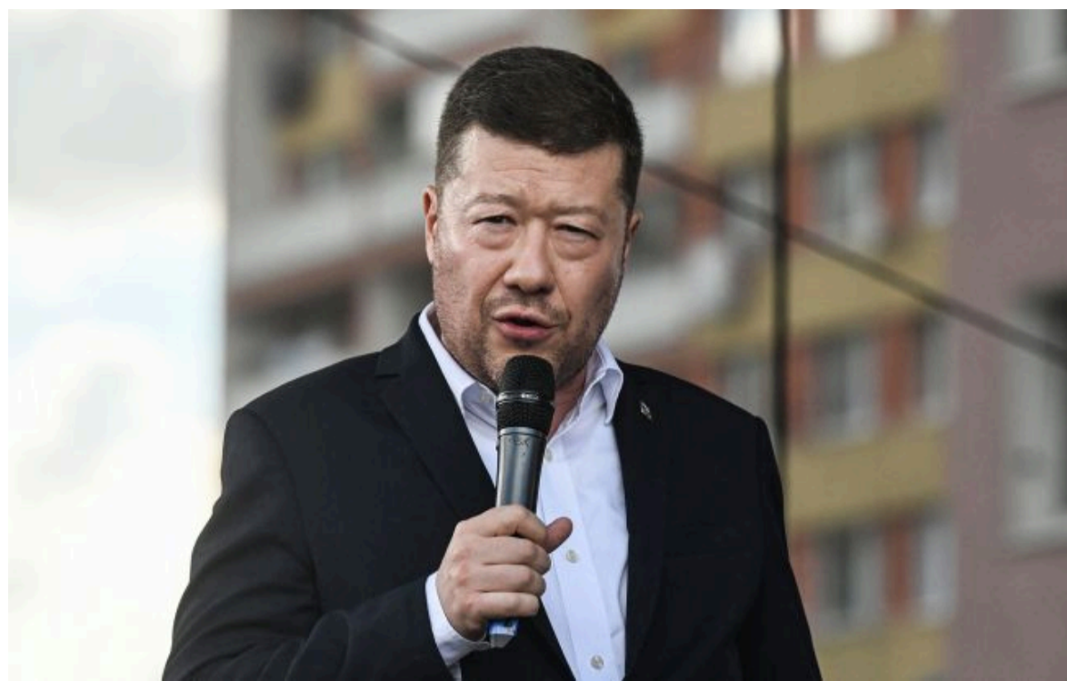
Фото: голова Палати депутатів Чехії Томіо Окамура

🔍 Не витрачай час на шум! Читай тільки суть з РБК-Україна у Google