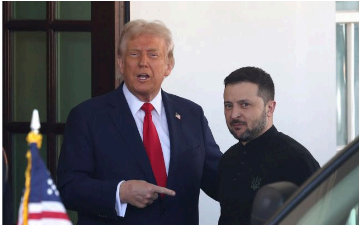
Фото: Дональд Трамп і Володимир Зеленський (Getty Images)