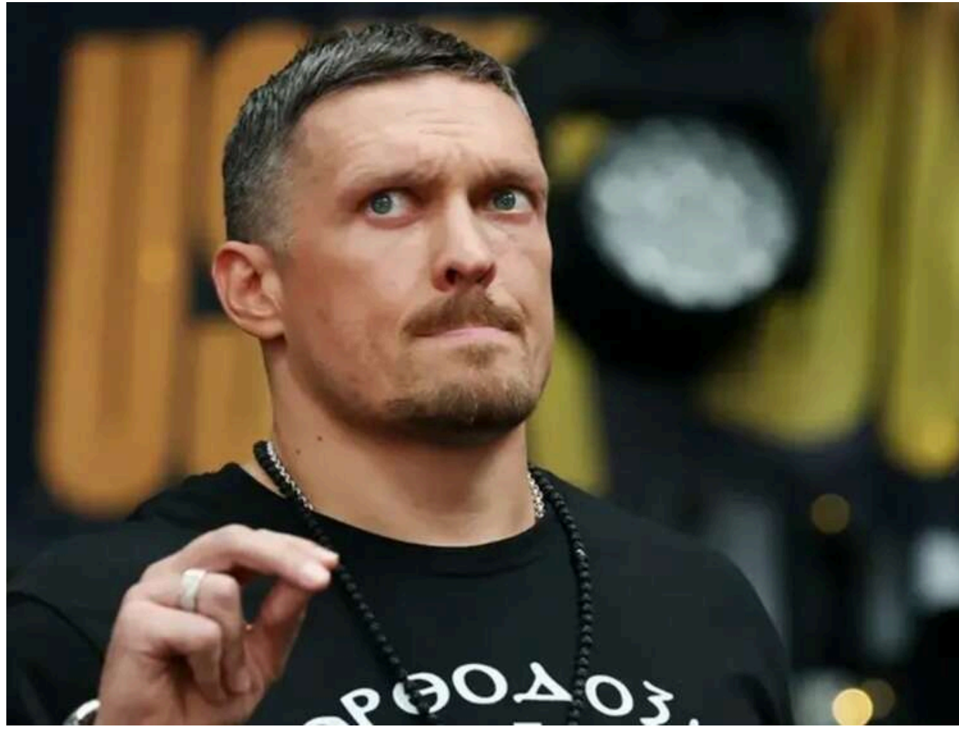
Олександр Усик зізнався, що багато років перебував під впливом російської пропаганди

Український боксер Олександр Усик розповів, що багато років перебував під впливом російської пропаганди.