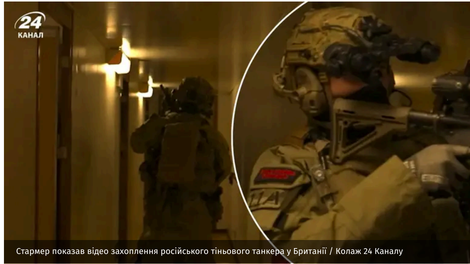
Стармер показав відео захоплення російського тіньового танкера у Британії / Колаж 24 Каналу

У мережі з'явилися кадри операції із затримання російського танкера Smyrtos , який відносять до так званого "тіньового флоту" Росії. Судно було перехоплено 14 травня біля південного узбережжя Великої Британії.