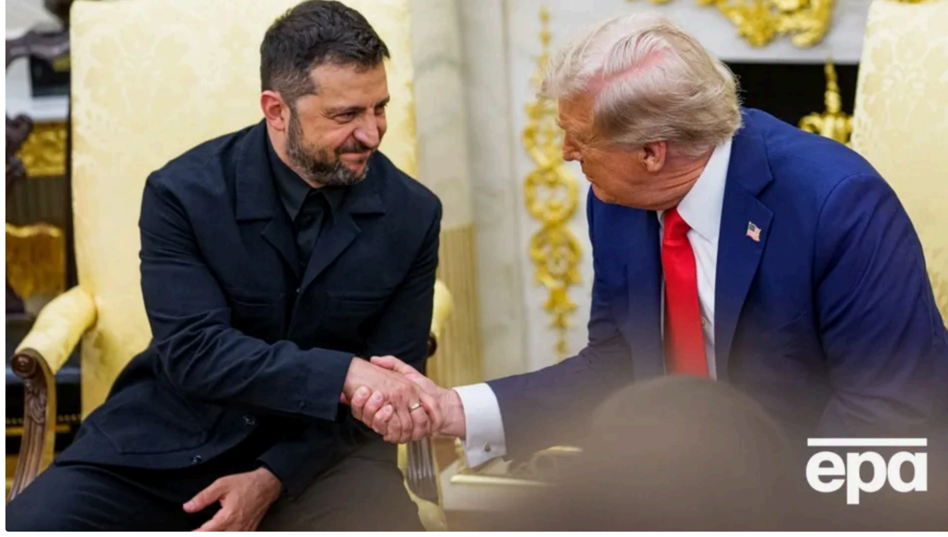
Зеленський і Трамп обговорюють подальші переговори

14 червня, 17.47 🗨️ Цей матеріал також можна прочитати на руском