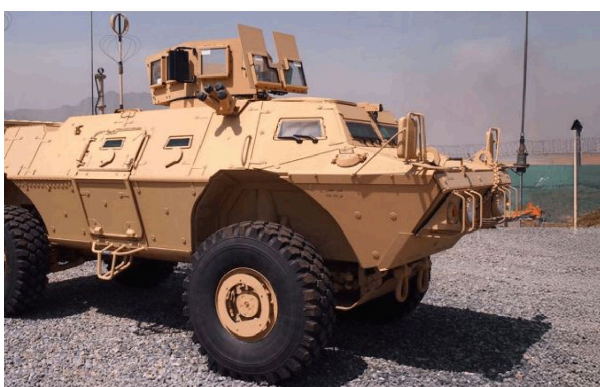
Фото: Бронемашина від Textron Systems (Textron Systems)