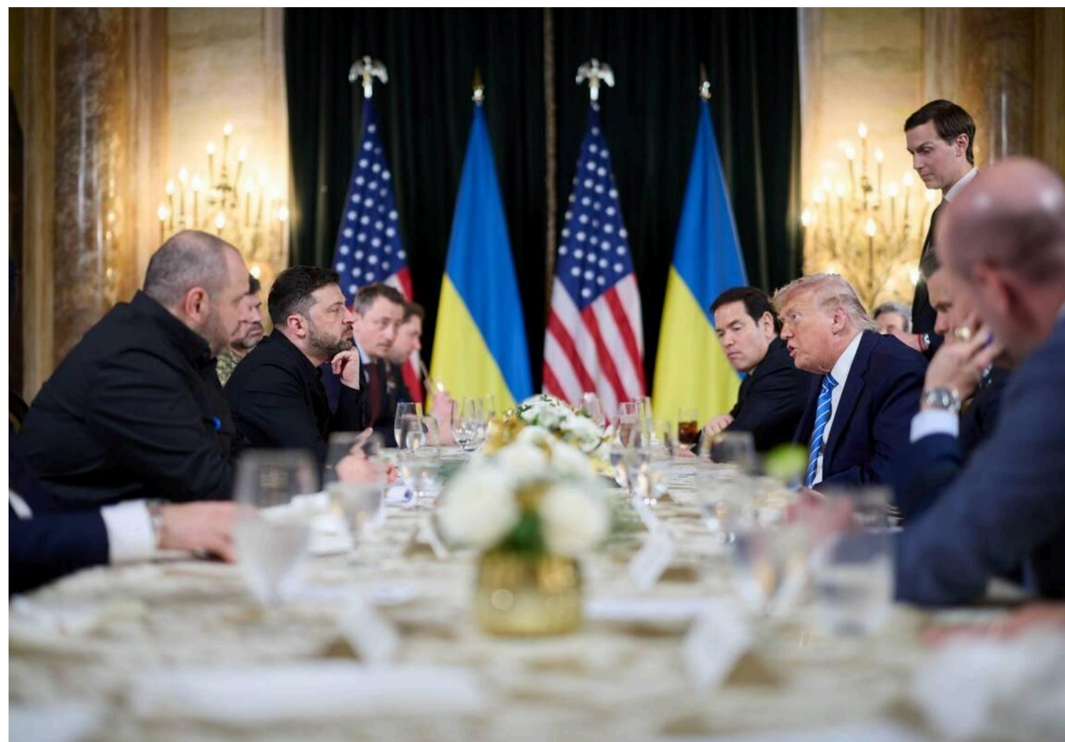
Президенти США та України зустрінуться у рамках робочої зустрічі лідерів під час саміту G7 у Франції

Але президент США все ще чинить опір Конгресу, який має намір відновити американську військову допомогу Україні.