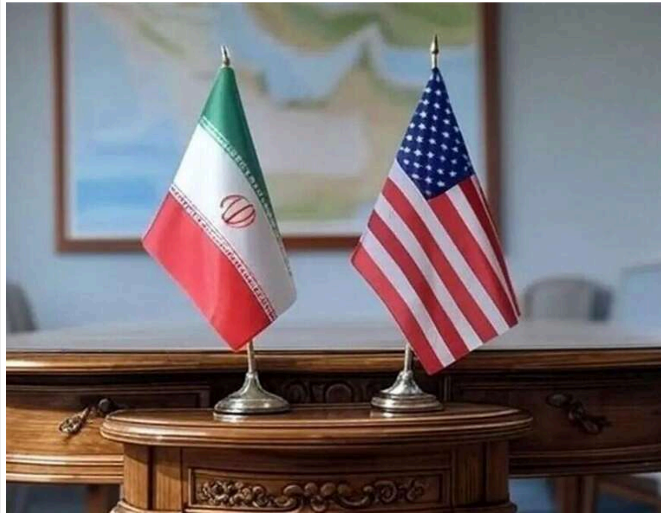
Тегеран може відмовитися від угоди з США через удар Ізраїлю по Бейруту, — спікер парламенту Ірану

Спікер іранського парламенту Мохаммад Галібاف, який очолює делегацію на переговорах, дав зрозуміти, що Тегеран може відмовитися від підписання угоди з Вашингтоном через нанесений сьогодні Ізраїлем удар по Бейруту.