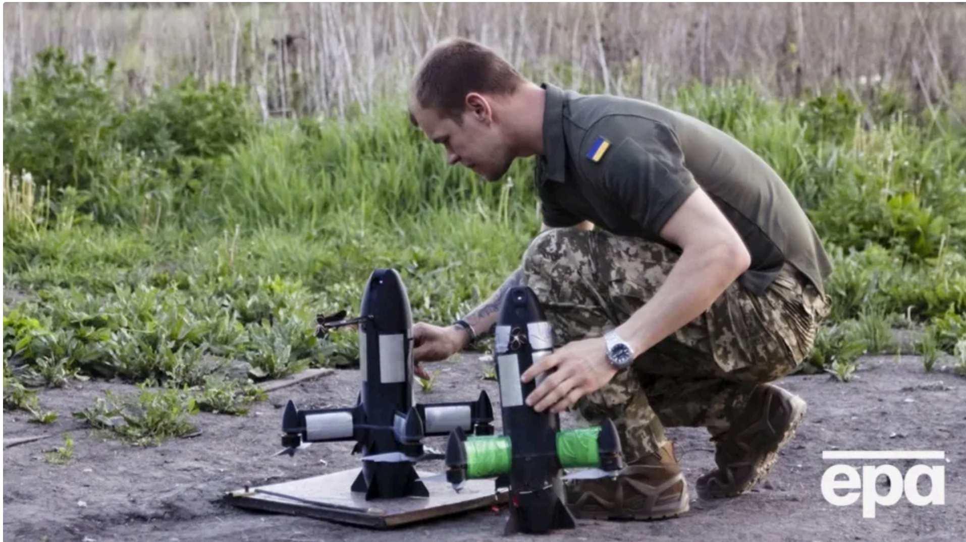
На тлі успіхів України в сфері безпілотників РФ зазнає значно більших втрат, ніж на початку війни

Військове керівництво країни-агресора Росії зазнає дедалі більших проблем із поповненням армії попри великі виплати за контрактну службу. Про це 14 червня інформує CNN.