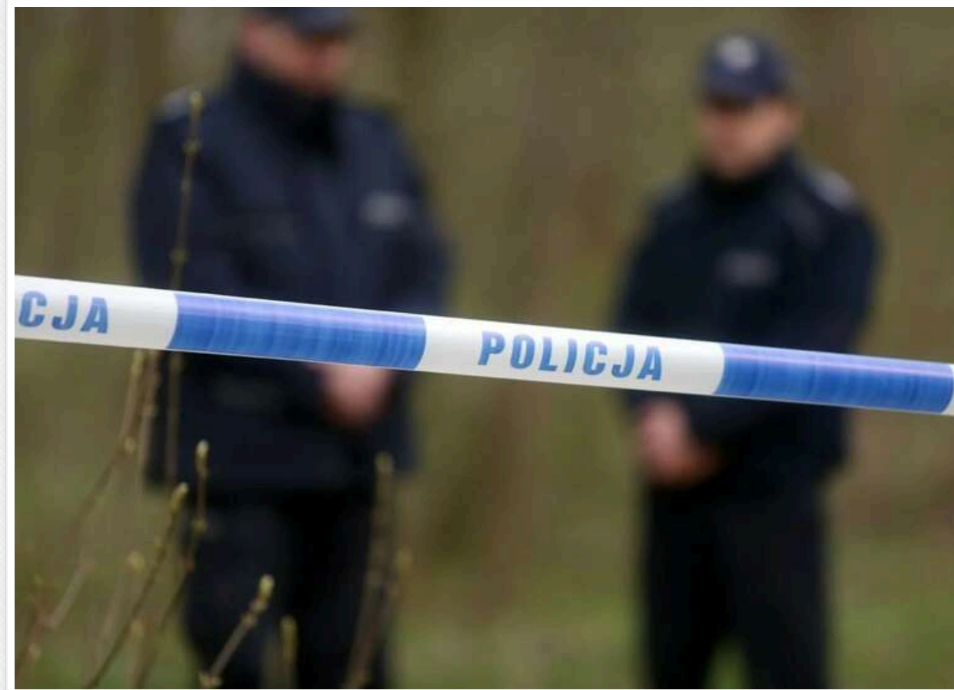
У Польщі на приватній ділянці колишньої лікарки виявили останки 32 ненароджених дітей

У селі Люториж поблизу Жешува на земельній ділянці, яка раніше належала лікарці, виявили останки 32 ненароджених дітей.