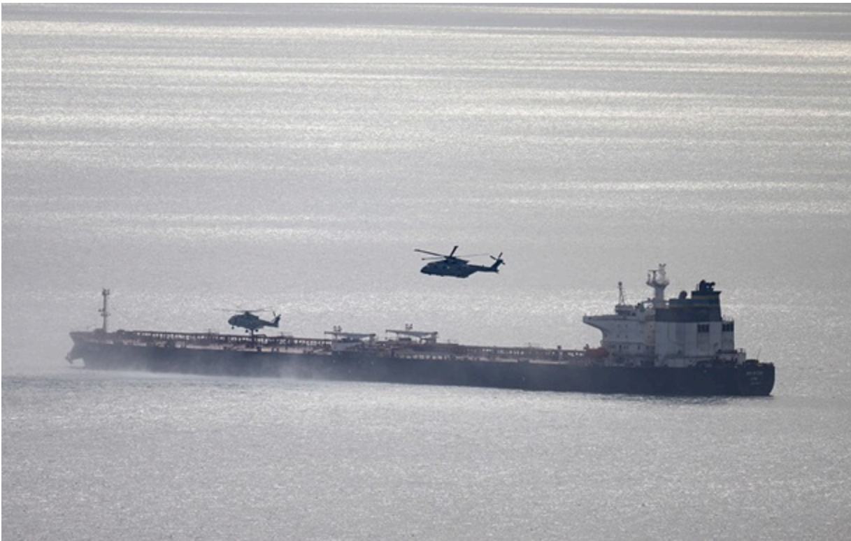
Затримання "тіньового" танкера британськими військами

Кілька танкерів тіньового флоту РФ, що йдуть під прапорами інших країн, розвернулися, не доходячи до Ла-Маншу