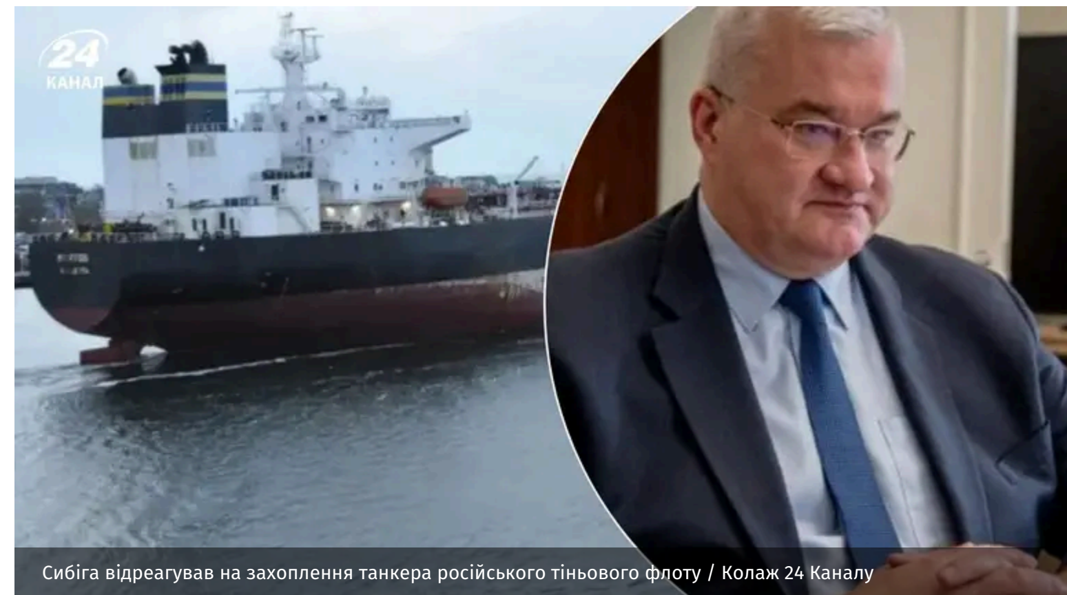
Сибіга відреагував на захоплення танкера російського тіньового флоту / Колаж 24 Каналу

Міністр закордонних справ України Андрій Сибіга позитивно оцінив дії Великої Британії щодо перехоплення танкера російського тіньового флоту. За його словами, боротьба з такими суднами допомагає обмежити фінансування російської воєнної агресії проти України.