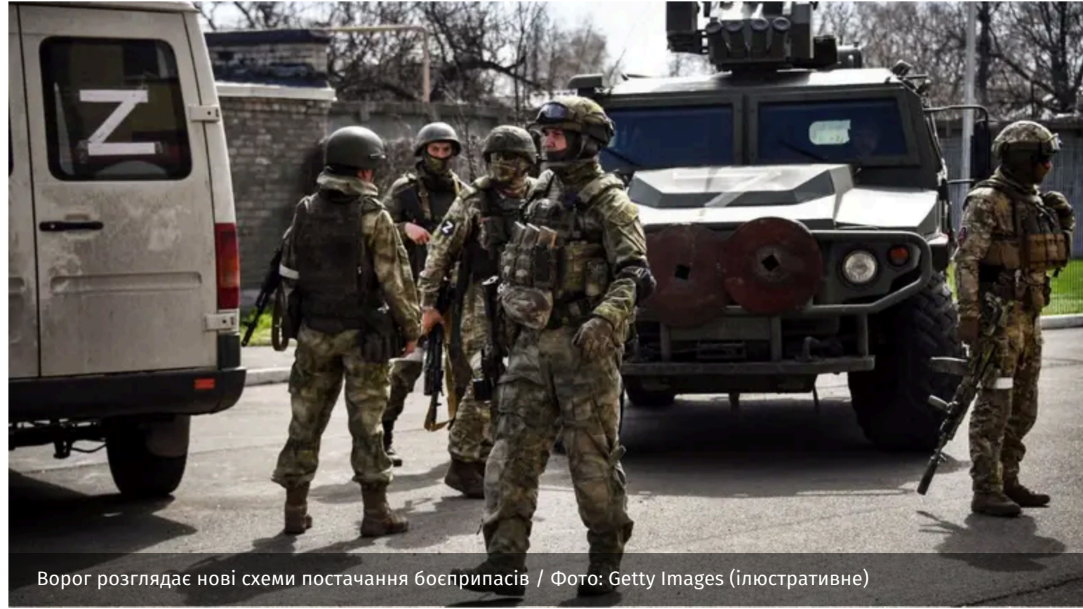
Ворог розглядає нові схеми постачання боєприпасів / Фото: Getty Images (ілюстративне)

Російські окупанти на Півдні намагаються перебудувати логістику через удари Сил оборони. Тепер боєприпаси планують перевозити цивільними легковими автомобілями з причепами, а особовий склад – розосереджувати та переміщати невеликими групами другорядними дорогами.