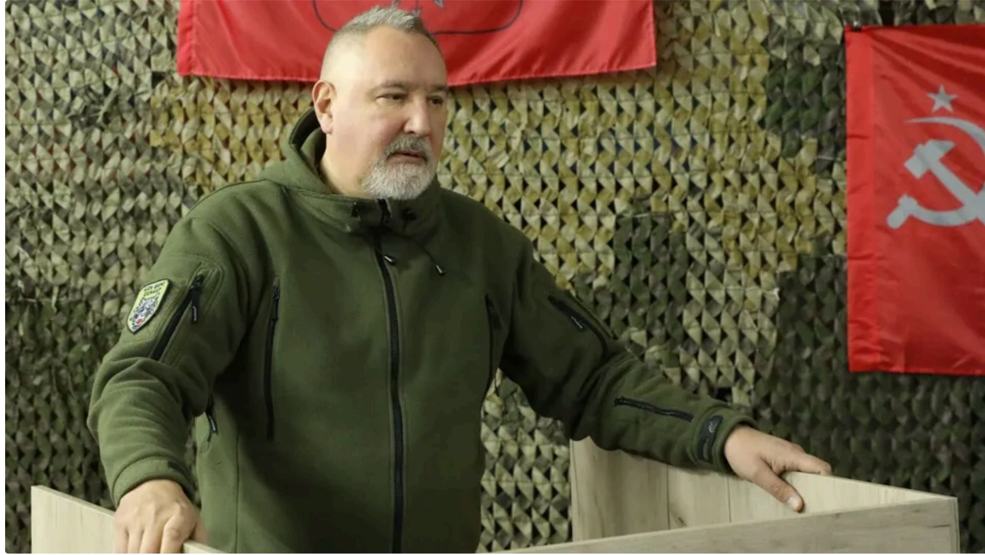
Рогозин обурився затриманню російського танкера у Ла-Манші

14 червня, 16.03 Этот материал также можно прочитать на русском