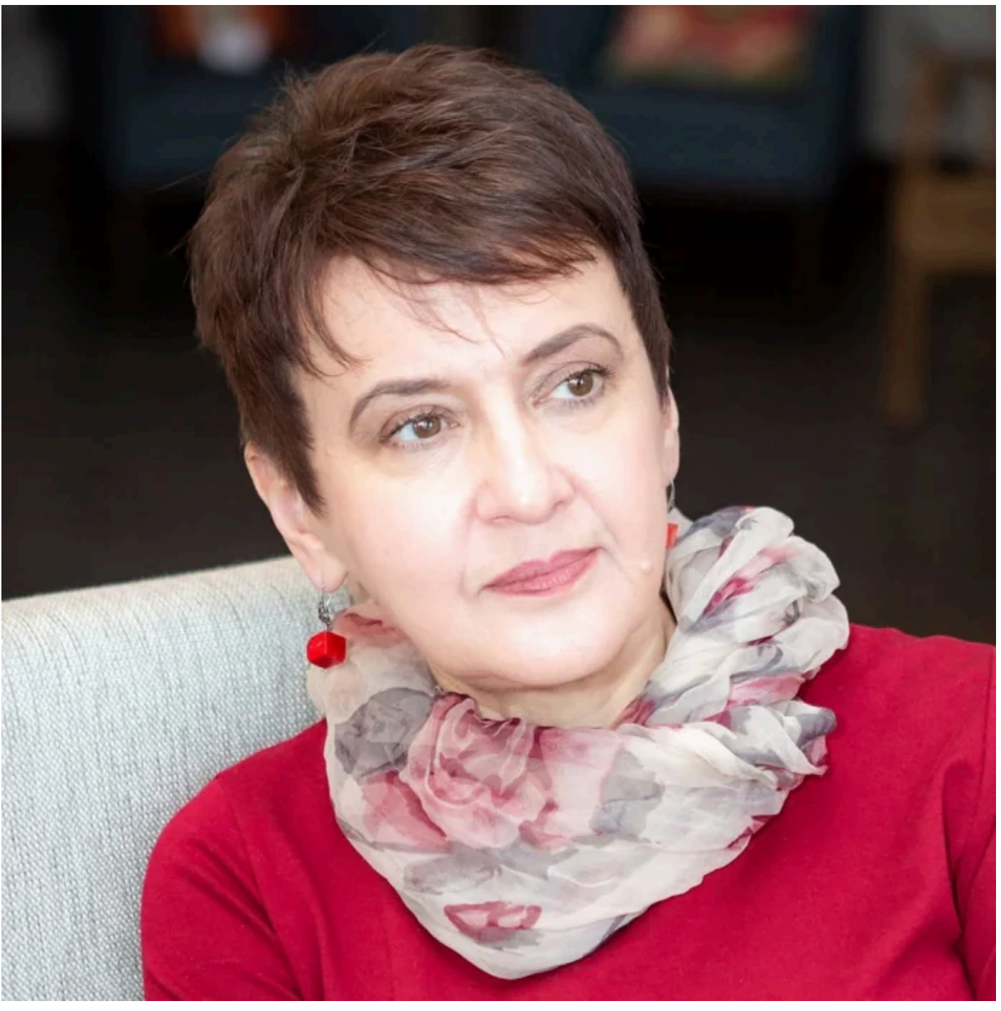
Оксана Забужко.

"Чіпка в дитинстві повісив kota. І, уявіть, ніхто з героїв Мирного не сміявся, що який малий бешкетник", – написала Забужко