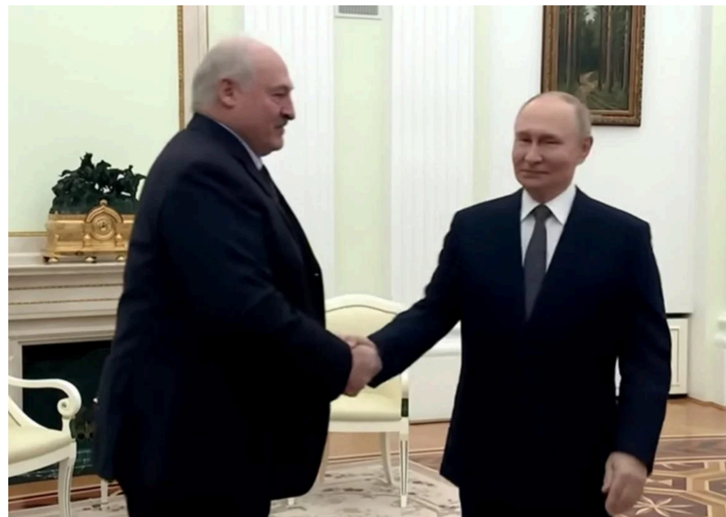
Прецеденти, за його словами, вже фіксувалися

Храпчинський наголосив, що країна може наносити маркування іноземних виробників.