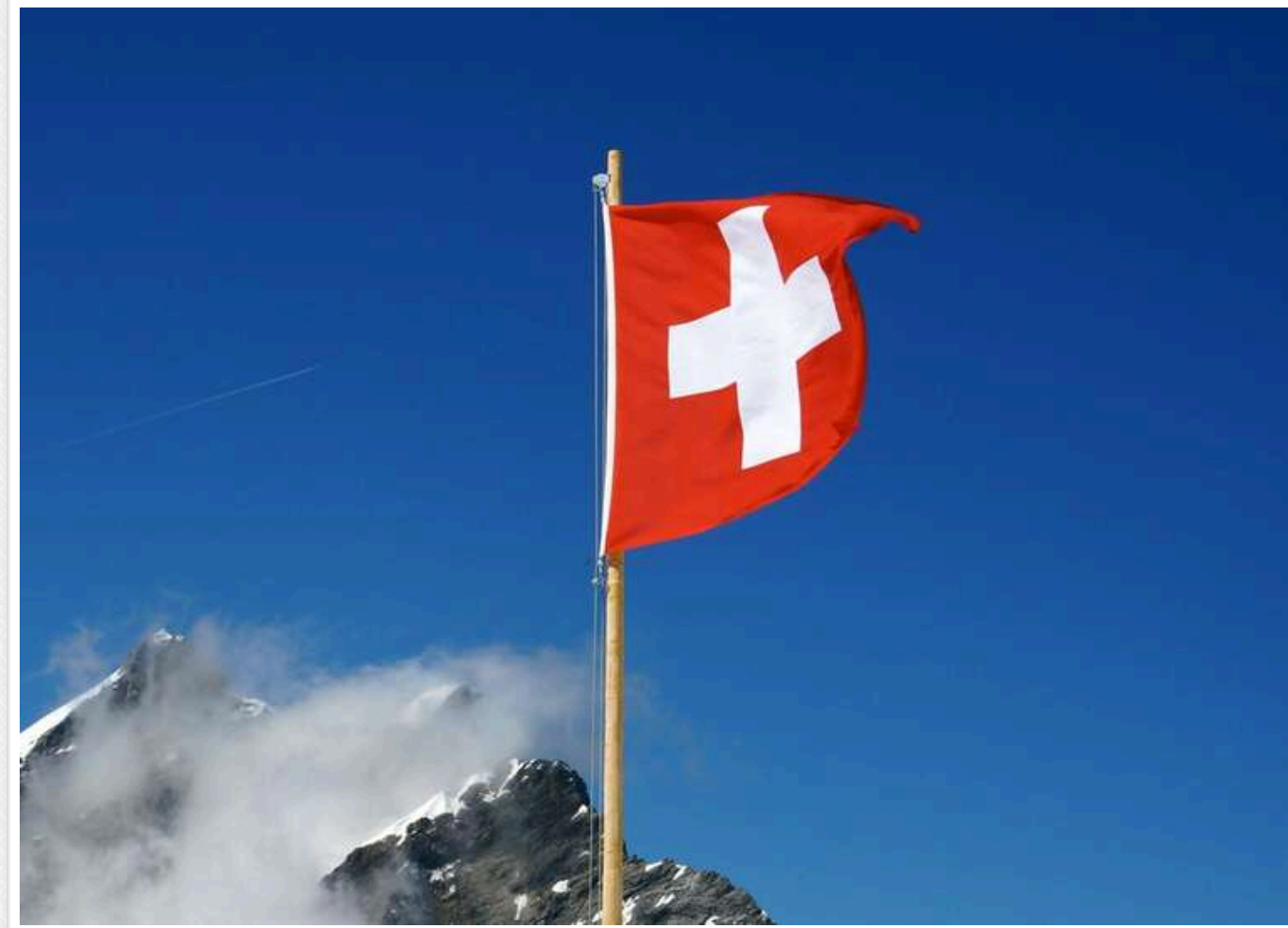
Страх втратити європейський ринок: чому референдум про обмеження чисельності населення у Швейцарії зазнає невдачі

Референдум у Швейцарії щодо обмеження чисельності населення країни 10 мільйонами осіб може завершитися невдачею.