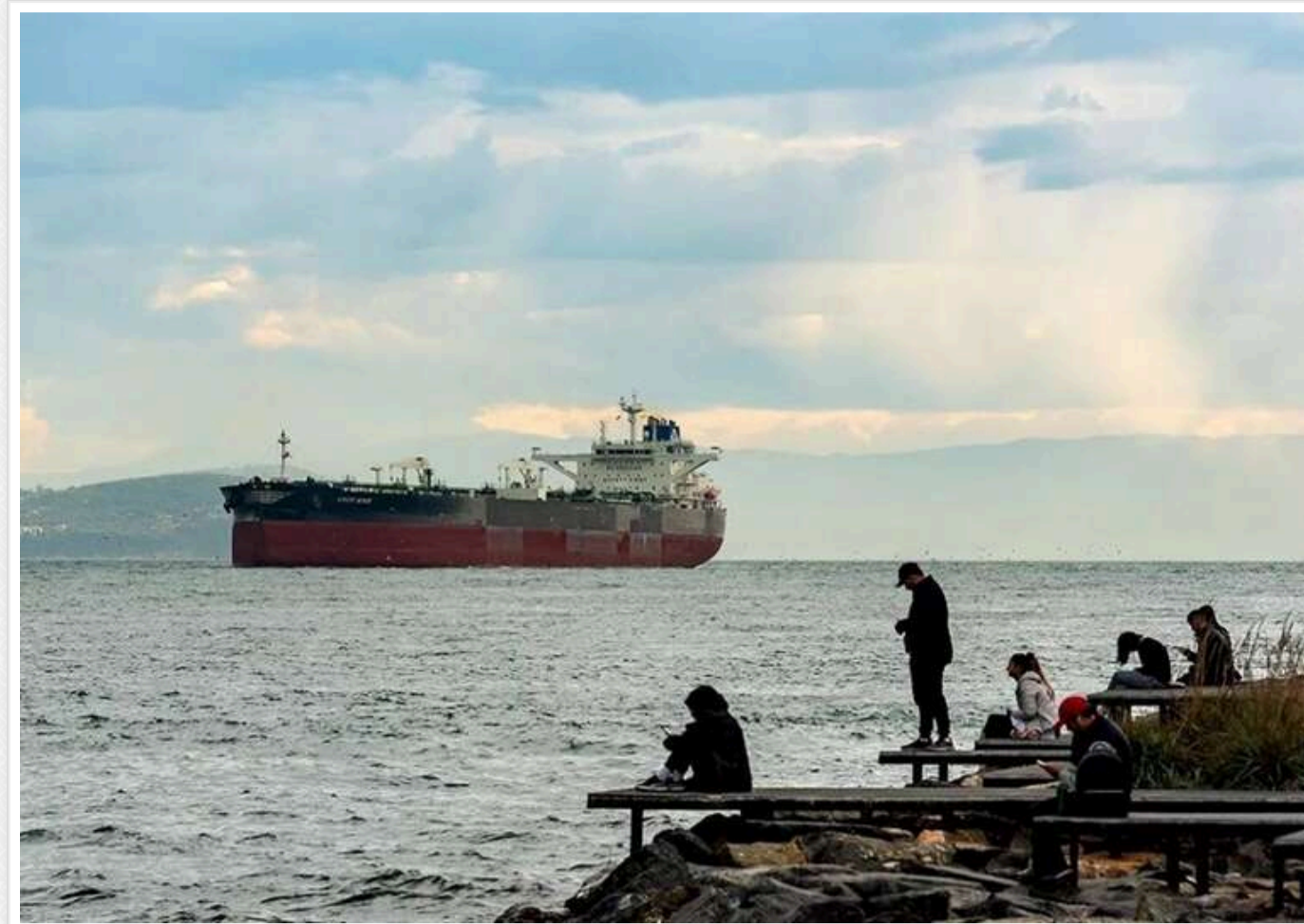
«Пару раз бахне»: у РФ закликають влаштувати екологічну катастрофу через затримання їхнього танкера

Сенатор РФ від захопленої частини Запорізької області Дмитро Rogozin пропонує мінувати російські танкери, щоб підірвати їх у разі захоплення західними країнами.