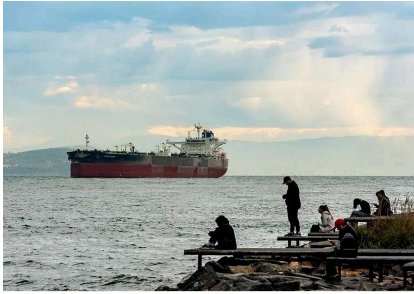
«Пару раз бахне»: у РФ закликають влаштувати екологічну катастрофу через затримання їхнього танкера

Сенатор РФ від захопленої частини Запорізької області Дмитро Rogozin пропонує мінувати російські танкери, щоб підірвати їх у разі захоплення західними країнами.