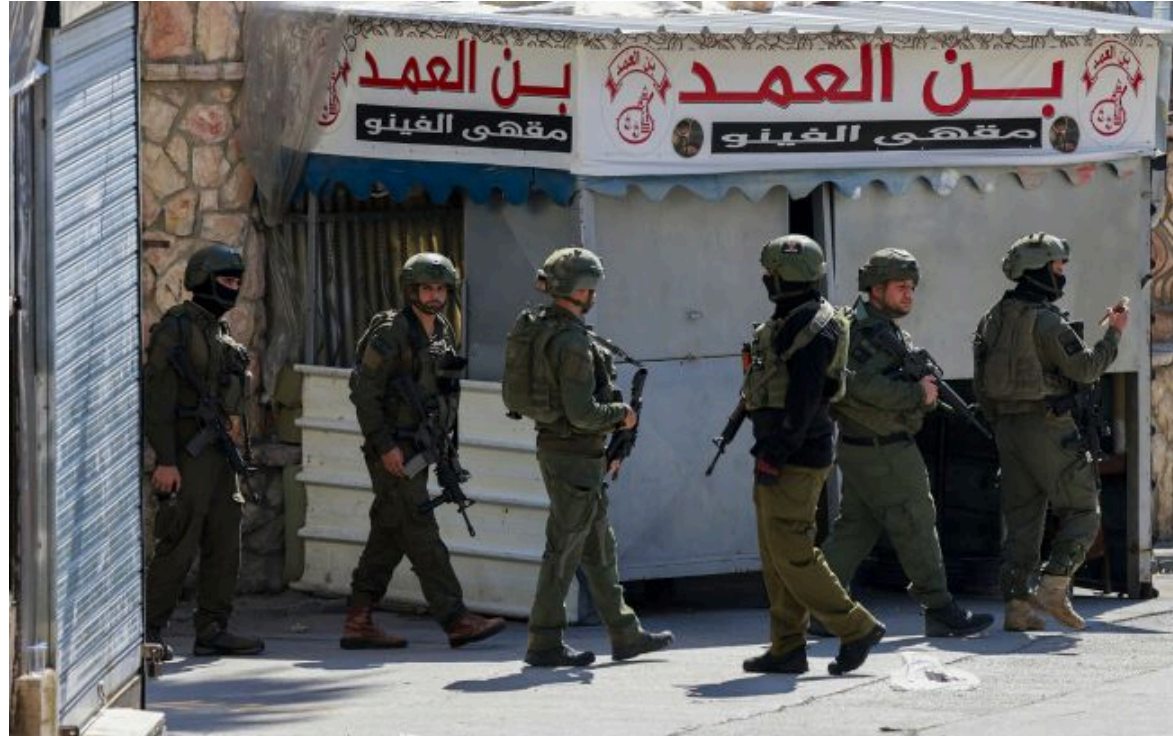
Фото: Ізраїль вдарив по "Хізбаллі" в Бейруті напередодні угоди США та Ірану