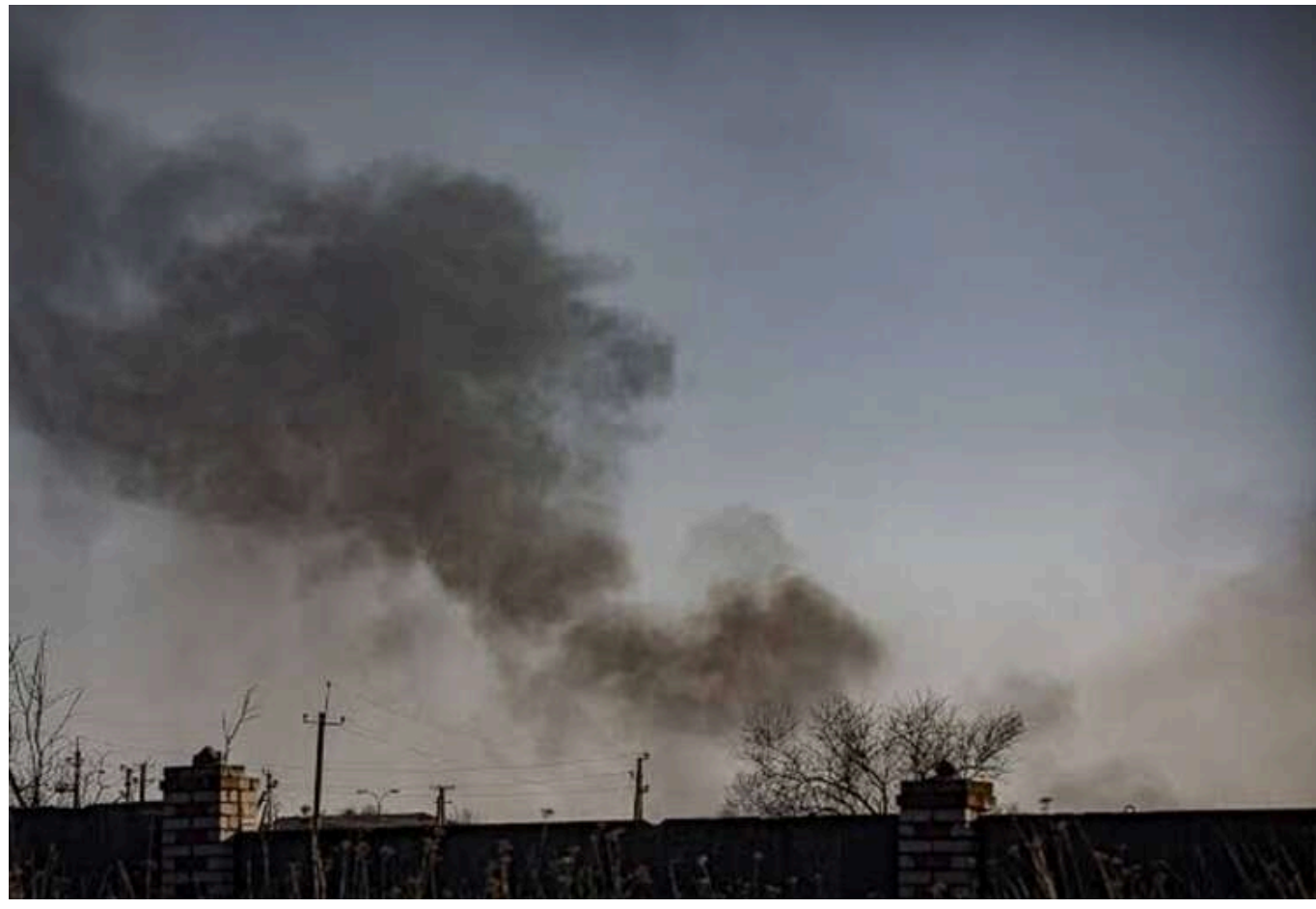
Удари по тилу РФ та окупантах: ЗСУ уразили командний пункт на Брянщині та майстерню дронів

Українські військові вдарили по командному пункту в Брянській області Росії та пунктах управління дронами на окупованих територіях.