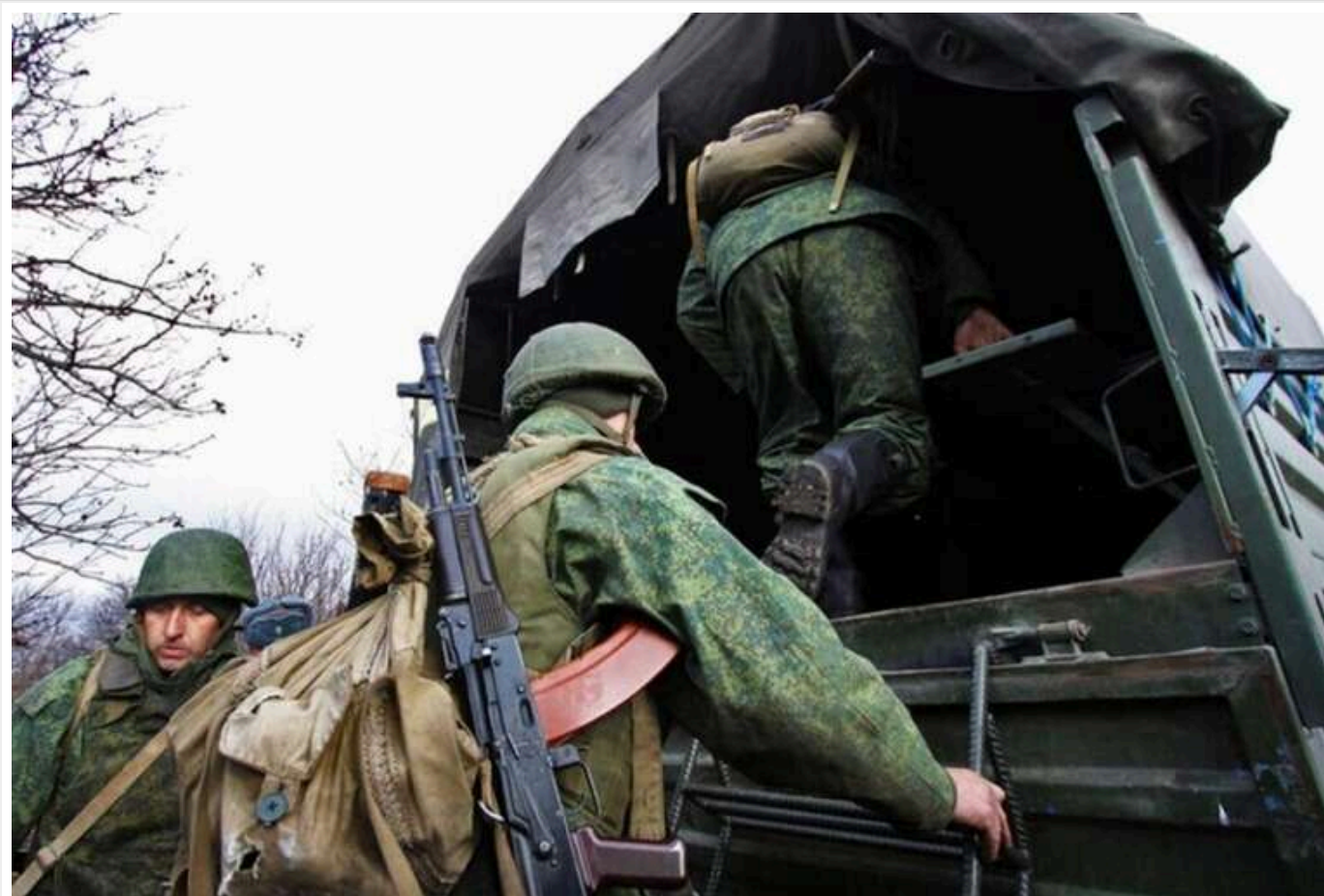
Росія змінює підходи до перевезення особового складу та БК через загрозу ударів ЗСУ, – Волошин

Російські війська на півдні України змінюють логістичні маршрути та схеми постачання через загрозу ураження з боку Сил оборони України. Йдеться про транспортування боєприпасів цивільним транспортом, а особовий склад планують перевозити невеликими групами.