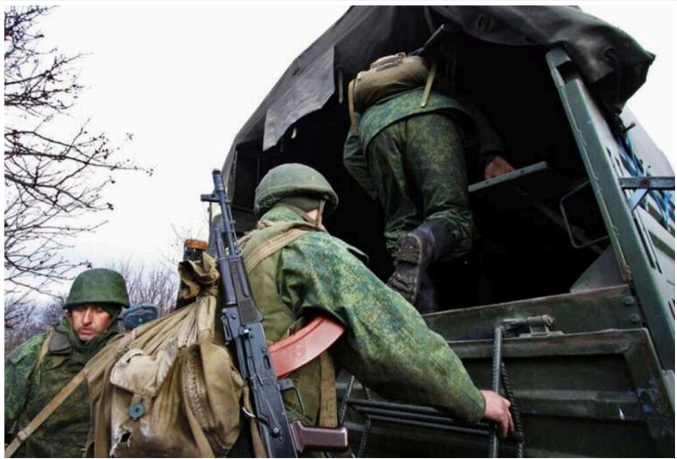
Росія змінює підходи до перевезення особового складу та БК через загрозу ударів ЗСУ, – Волошин

Читати на руськом Read in English Додати як бажане джерело в Google