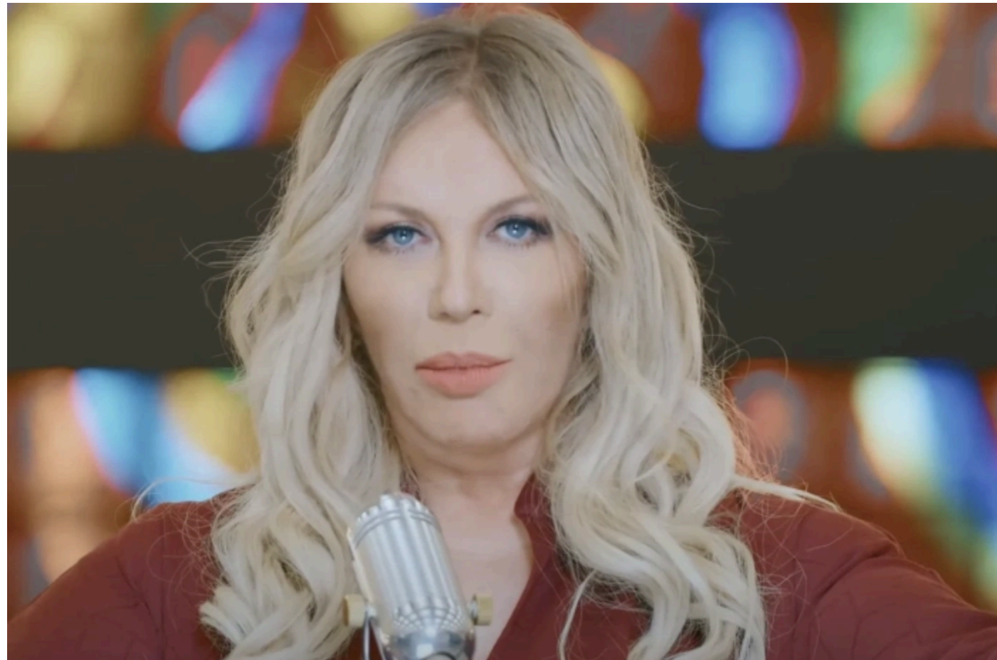
Таїсія Повалій.

Втім, як повідомляє ChatGPT, автоматичного сценарію "як у Повалій" для Ані Лорак наразі не існує . Сам факт володіння нерухомістю або проживання в Росії не означає негайної конфіскації. Для цього необхідні юридичні підстави та відповідні рішення суду.