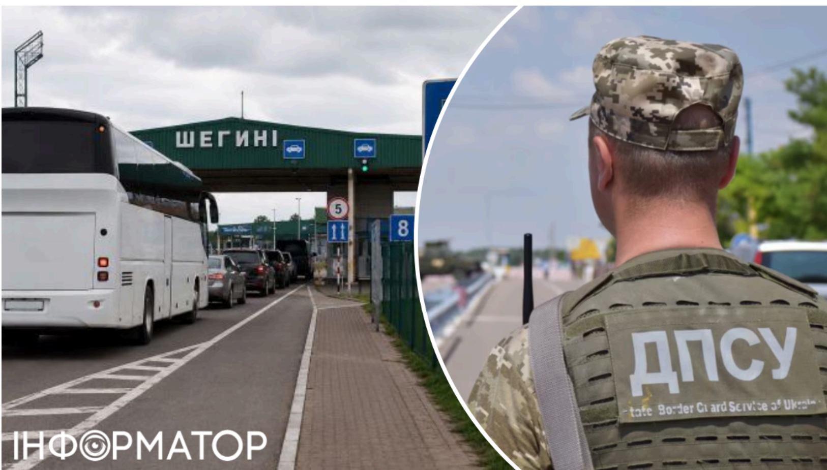
Затримки автобусів на КПП "Шегині-Медика" - причина

Пасажирів автобусів, які планують виїзд до Польщі через КПП "Шегині-Медика" , попереджають про можливі затримки. З 15 червня на польській стороні переходу стартували ремонтні роботи на смугах руху, призначених для оформлення автобусів. Прикордонники рекомендують враховувати ситуацію і по можливості обирати альтернативні пункти пропуску .