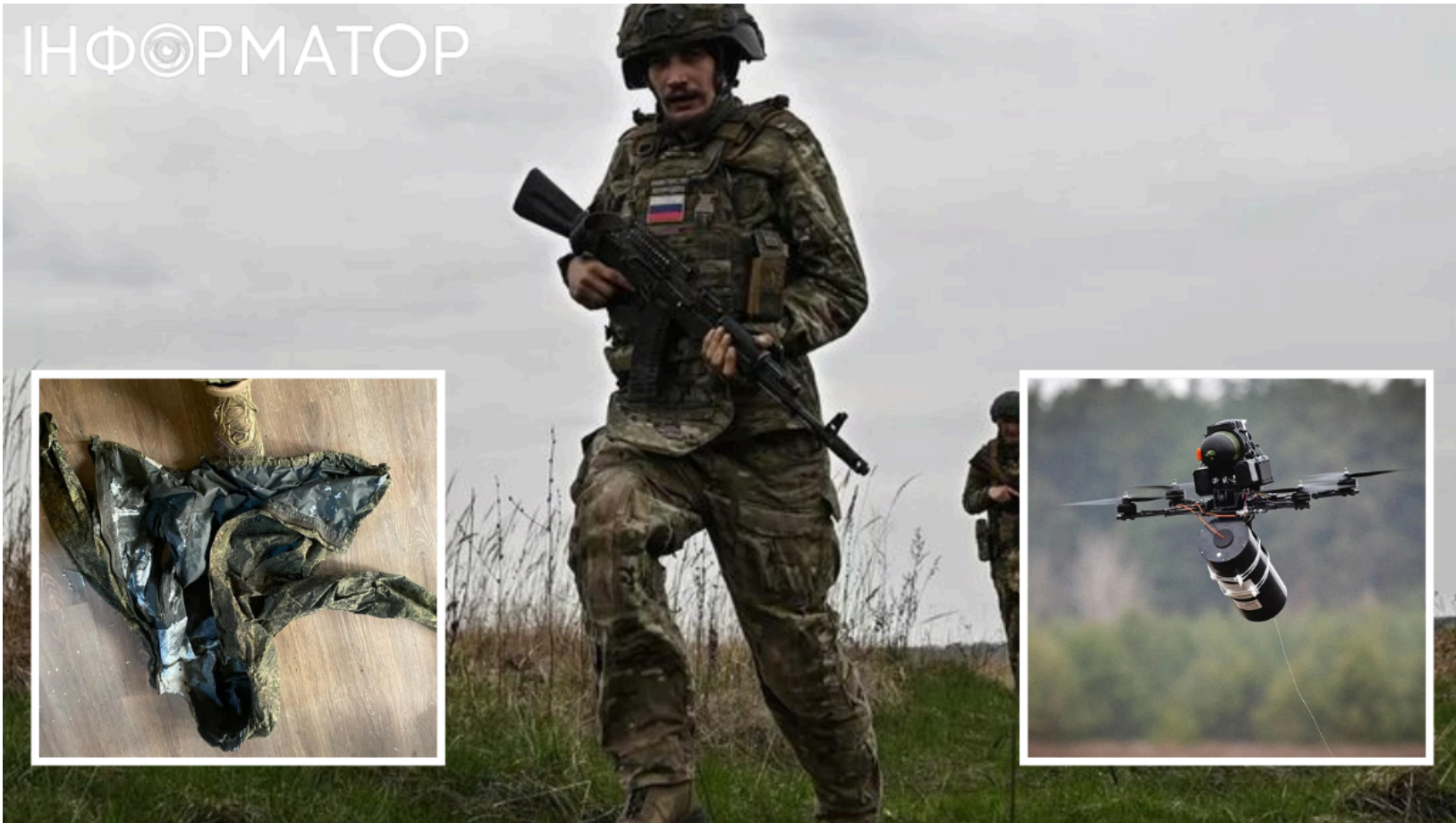
купанти маскуються під цивільних через дрони ЗСУ