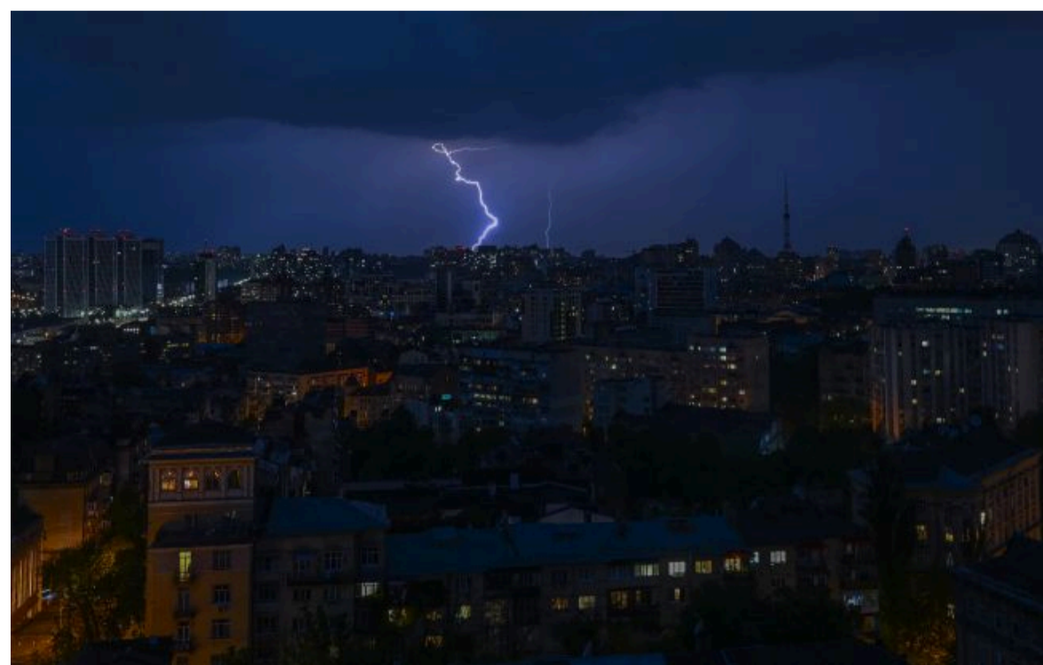
Фото: на Київ насувається гроза (Getty Images)