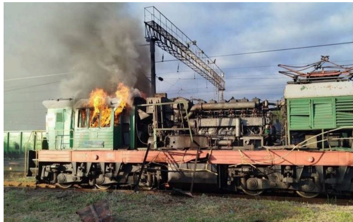
Фото: Під ранок дрони влучили в локомотив на Харківщині