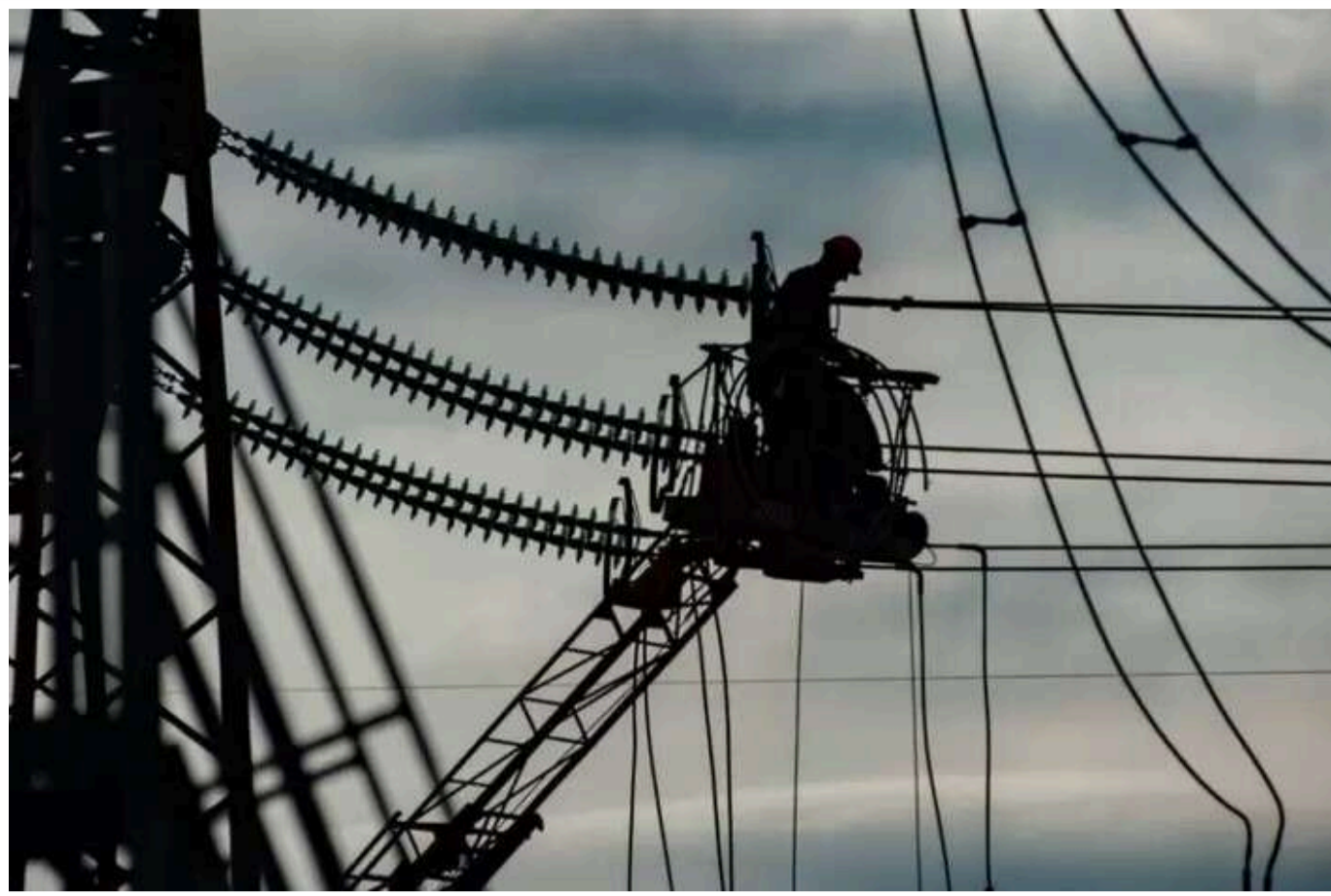
Окуповані частини Херсонської та Запорізької областей залишилися без світла: колаборанти звинувачують українські атаки

Читати на руськом Read in English Додати як бажане джерело в Google